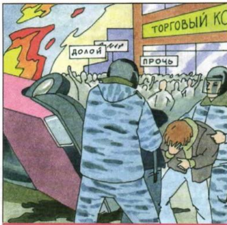
Демонстрация, которая переросла в хулиганские действия и беспорядки

Экстремизм – это приверженность отдельных людей или групп к крайним взглядам и поступкам, которые подспудно или непосредственно направлены против законных политических прав и свобод граждан, являются угрозой для гражданского мира, национального согласия и духовной, религиозной терпимости в обществе и государстве. Экстремистские взгляды и действия – это прямой путь к нарушению закона.